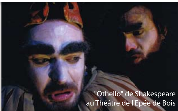
"Othello" de Shakespeare au Théâtre de l'Épée de Bois