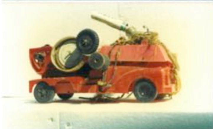
Les créations/jouets de Jean Bordes. Photos: Jano Pesset